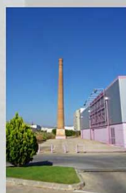
CENTRAL LECHERA MALAGUEÑA, "COLEMA"